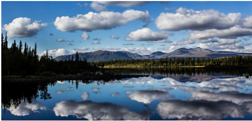
Kultsjön med Marsfjällen i bakgrunden